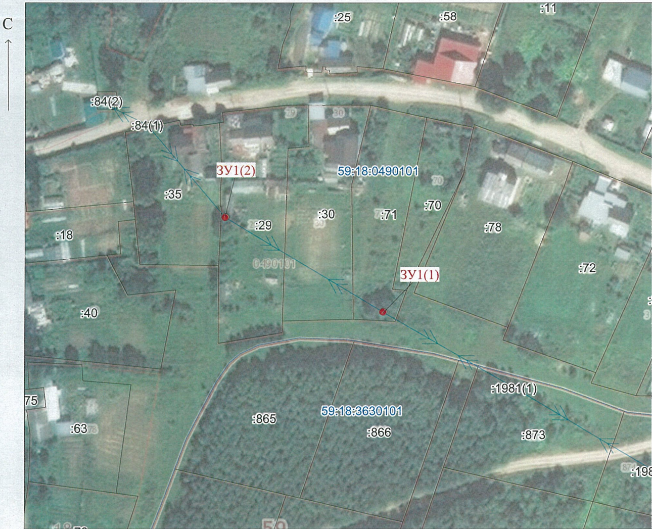
МСК-59, зона 2